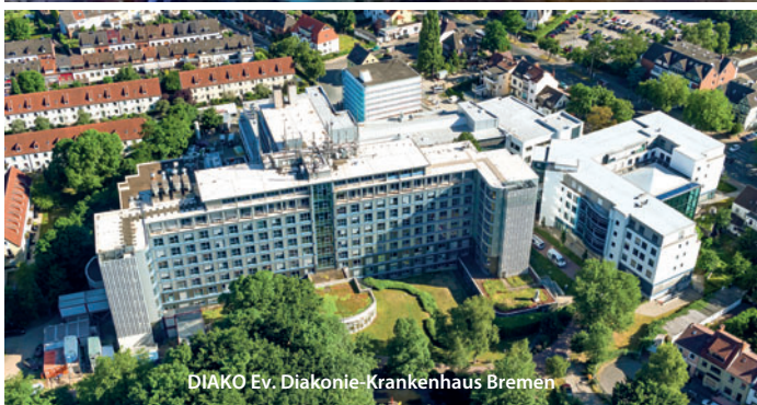
DIAKO Ev. Diakonie-Krankenhaus Bremen