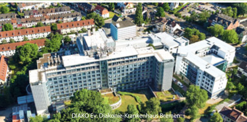
DIAKO Ev. Diakonie-Krankenhaus Bremen