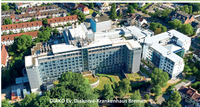
DIAKO Ev. Diakonie-Krankenhaus Bremen