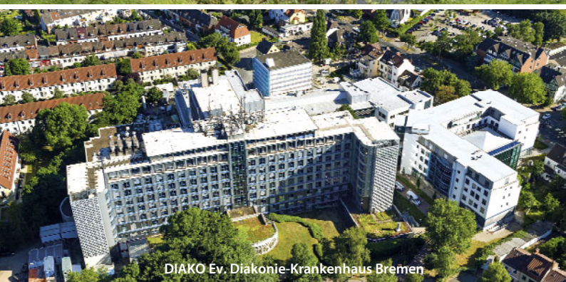
DIAKO Ev. Diakonie-Krankenhaus Bremen